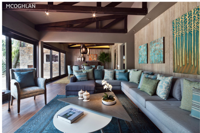
Sala del proyecto residencial Casa Laurel.

Proyectos: Corporativo IXE, rediseño de imagen de Scotiabank, imagen de Farmacias Dermatológicas, centros de distribución de calzado Andrea.