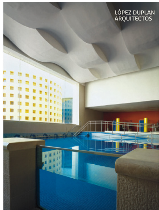
CRIT Estado de México. Inaugurado en 1999.

El consejo: “Cuando la gente adquiere una casa, le sugiero que se asesore con un especialista e indague qué tantas posibilidades tiene el lugar. Que evalúe la parte técnica, no sólo si está bien pintada. Si la va a remodelar, el consejo es que observe si los espacios son adecuados para sus necesidades”, anota López Duplan.