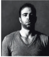
Elías Kababie Kababie Arquitectos