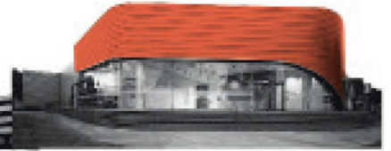
Centro de contacto DF