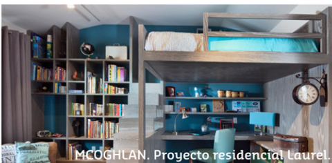
MCOGLAN. Proyecto residencial Laurel.