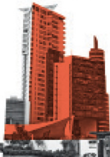
Central Park Querétaro