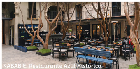
KABABIE. Restaurante Azul Histórico.