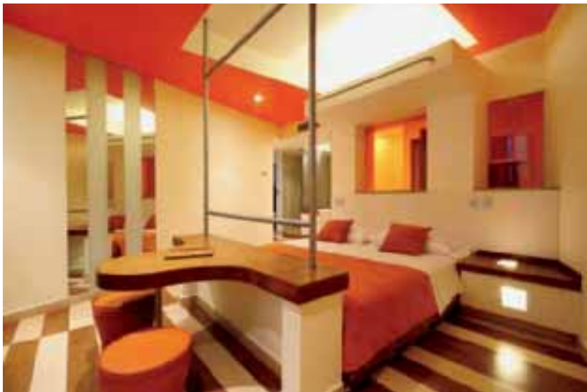
A GIRAR. Tubulares de acero envuelven la cama girada a 30 grados y rodeada de transparencias.

Soy un provocador que siempre cuestiona lo preestablecido y replantea nuevas formas, reconoce Vázquez Durán, quien tiene una definida concepción modernista del interiorismo.