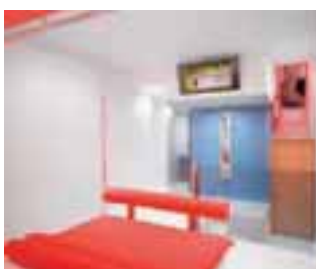
LUZ Y COLORES. Elementos clave en los diseños de DIN. Arriba, motel Kroma, en Jalapa, Veracruz, y abajo, motel Aquz, en el Estado de México.