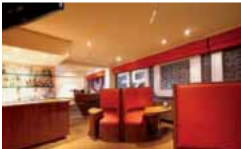
ESPACIOS CURVILÍNEOS. Un diseño sin patrones regulares que cambia entre líneas y curvas.